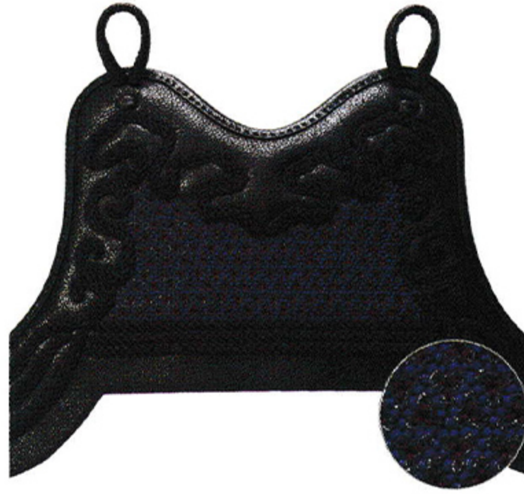
M23 関東S松飾り毘沙門