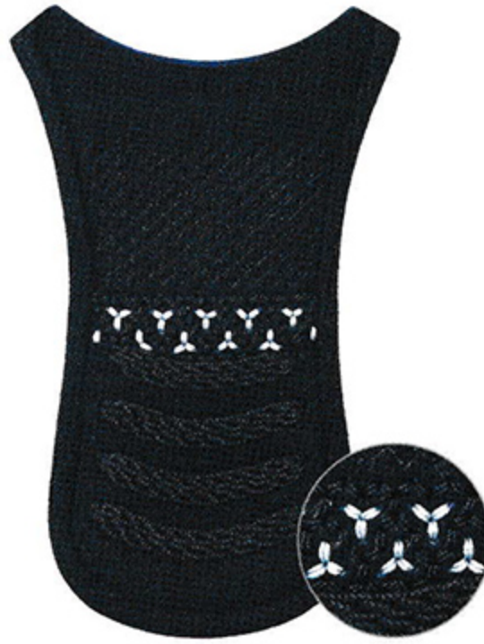
ナナメ刺一段毘沙門