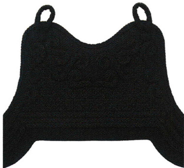
M28 織刺地関東S飾り普通亀甲