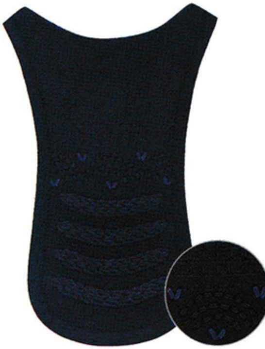
碁盤刺一段波千鳥入