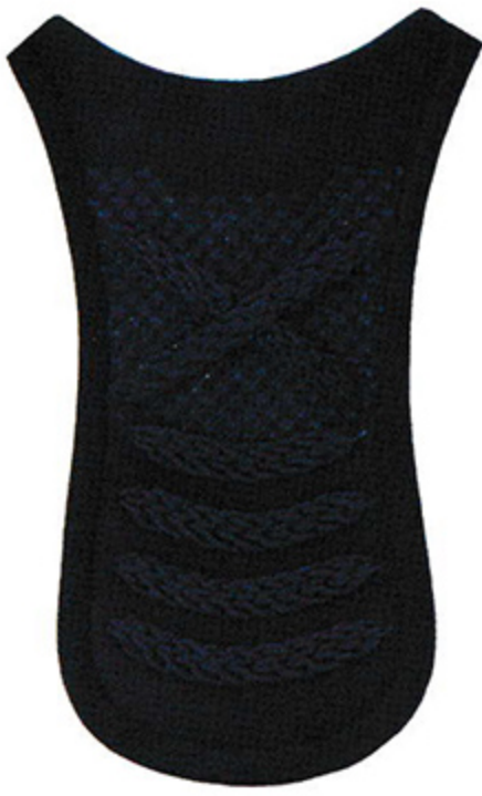
バッテンナナメ刺